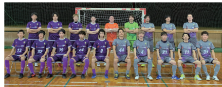
愛知県フットサルリーグ所属 「Cuatro Futsal Club」