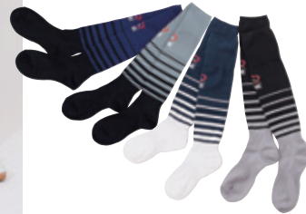
ONE-S0111 BORDER SOCK COLOR: BLACK/WHITE/GRAY/NAVY ●●●○ QUALITY: POLYESTER SIZE: 16~19/19~21/22~24/ 25~27/27~29 PRICE: 1,650 taxin