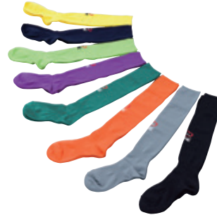
ONE-S0104 SIMPLE LOGO SOCK COLOR: BLACK/GRAY/ORANGE/ GREEN/PURPLE/P GREEN/NAVY/ YELLOW ●●●●●●●● QUALITY: POLYESTER SIZE: 16~19/19~21/22~24/ 25~27/27~29 PRICE: 1,680 taxin