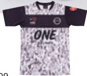
ONE-S0109 CAMO S/S TRAINING SHIRT COLOR: BLACK/WHITE ●○ QUALITY: POLYESTER SIZE: 110~150/XS/S/M/L/XL/XXL PRICE: 4,730 taxin