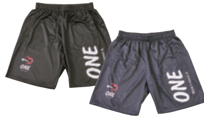
ONE-S0102 BIG LOGO TRAINING PANTS COLOR: BLACK/NAVY ●● QUALITY: POLYESTER SIZE: XS/S/M/L/XL/XXL PRICE: 4,990 taxin