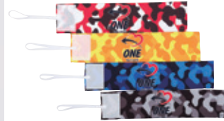
ONE-S0116 CAPTAIN MARK COLOR: RED/YELLOW/ BLUE/GRAY ●●●● QUALITY: POLYESTER SIZE: 大人FREE/ジュニア PRICE: 1,680 taxin