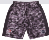
ONE-S0110 CAMO TRAINING PANTS COLOR: BLACK/WHITE ●○ QUALITY: POLYESTER SIZE: 110~150/XS/S/M/L/XL/XXL PRICE: 4,990 taxin